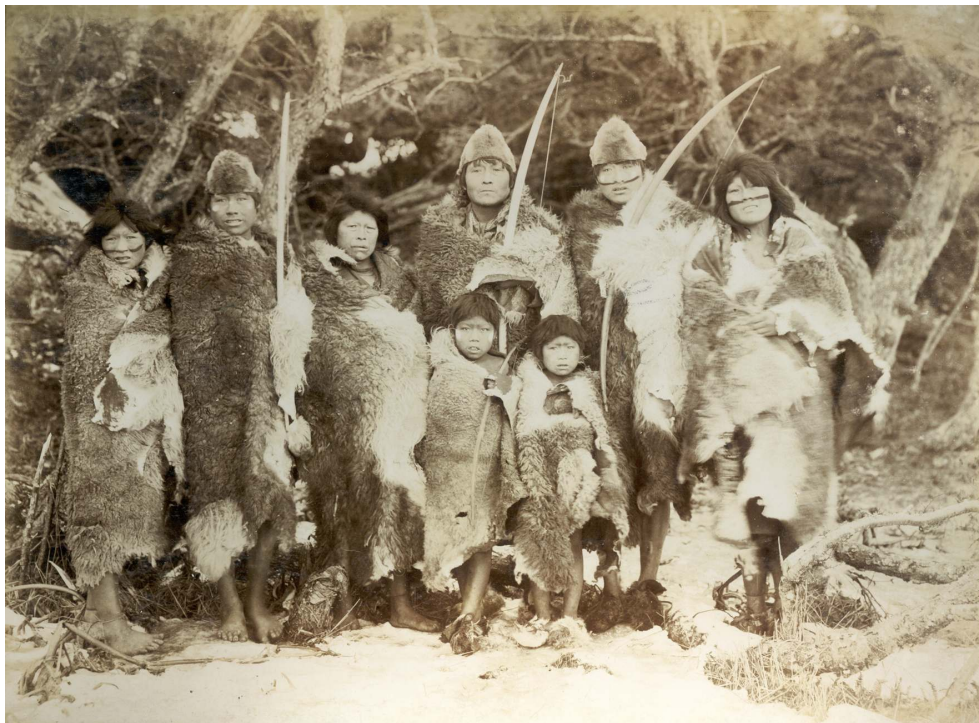
IMAGEN 2 – Grupo de Shelk'nam/Haush posando con múltiples arcos y flechas. Fotógrafo William Barclay, 1902. Fotografía publicada en Brüggemann, Anne Der Travernde Blick. Martin Gusindes Fotos der letzten Feuerland-Indianer , Frankfurt, Museum für Völkerkunde. 1989.

representaron a los Shelk'nam/Haush como cazadores terrestres, en coincidencia con el imaginario del cazador armado con arco y flecha, en el registro escrito también se mencionaron artefactos asociados a la pesca y captura de animales marinos, como los arpones, que no aparecen en el registro fotográfico. Esta pequeña diferencia entre registros parece indicar que la información escrita reconoció mayor variabilidad de artefactos que el registro fotográfico.