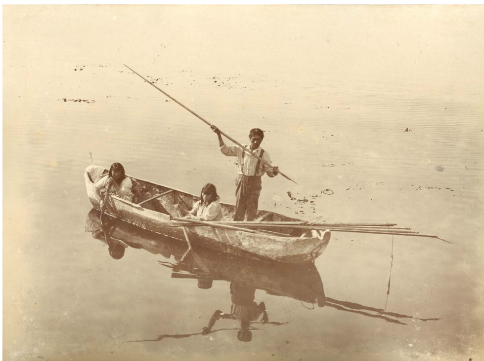
IMAGEN 3 – Grupo de Yámanas/Yagán en una canoa con remos y arpones.