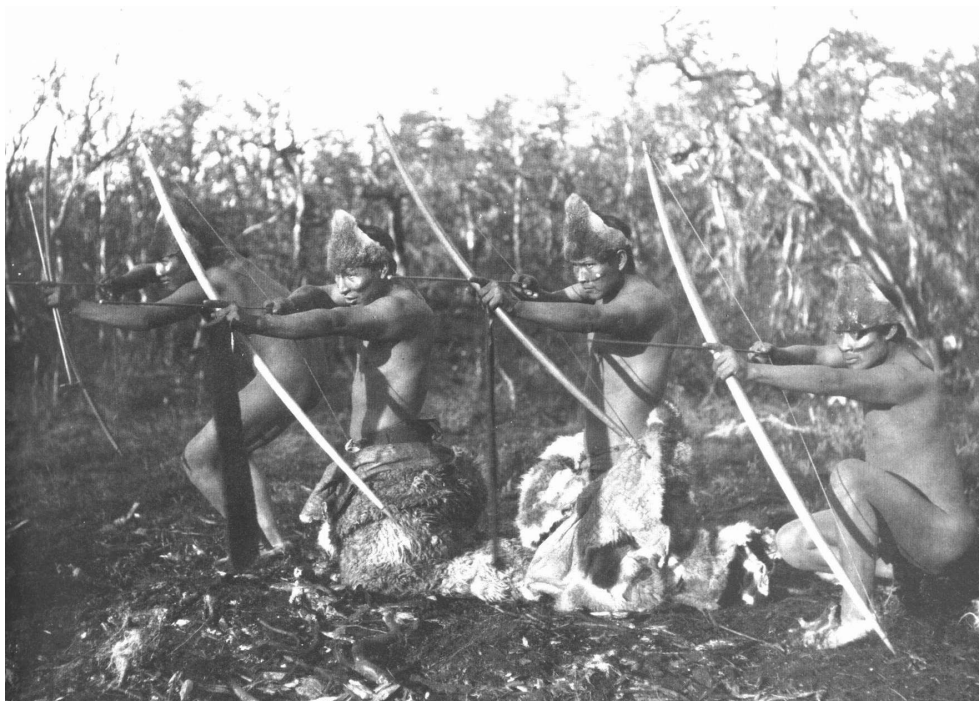
IMAGEN 4 – Grupo de cazadores shelk'nam/haush empuñando arcos y flechas.

de caza/pesca femenina. Si bien hay fotografías de mujeres pescando (y no de varones), en ninguna de ellas se puede apreciar el uso del arpón. Por lo tanto, se podría pensar que la representación de los varones en la subsistencia implicó la inclusión de artefactos, mientras que las mujeres no fueron representadas manipulando ningún instrumento, como si el ethos femenino no incluyera la manipulación de tecnología.