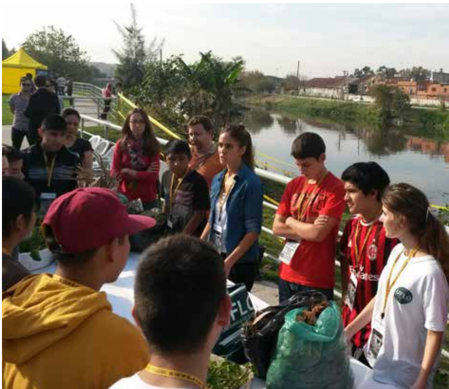
Figura 6. Actividades de construcción de bio-rollos junto a alumnos de una escuela secundaria de la zona.

El día de la instalación de los bio-rollos se convocó a la Escuela Media EEM N°2 Arturo Jauretche de la zona para que los alumnos pudieran conocer la actividad y formar parte de ella (Fig. 6).