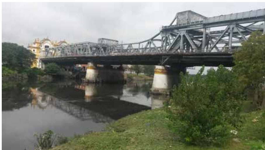
Figura 2. Puente Alsina (Puente Uriburu o Ezequiel Demonty).

Se determinaron contenido de metales pesados en sedimentos y en tejidos aéreos y subterráneos de dos especies nativas que crecen en el área piloto: Sagittaria montevidensis y Tradescantia fluminensis y un árbol exótico Morus alba . Los niveles de cromo total y cobre en los sedimentos superaron los niveles guía propuestos para uso residencial por la legislación argentina (Decreto Reglamentario 831/93, Ley 24051). Los niveles de cromo, plomo y zinc se encontraron por encima de los valores PEL (valor más probable para que ocurran efectos biológicos adversos (de Cabo et al. , 2019). Las concentraciones de metales pesados medidos en S. montevidensis revelan que esta planta es capaz de absorber y acumular cromo, plomo, zinc y cobre en estructuras subterráneas. En el caso de T. fluminensis , absorbió cromo, zinc, plomo, níquel y cobre, los que quedaron acumulados principalmente en la estructura subterránea y secundariamente en hojas (de Cabo et al. , 2019). Para el caso de Morus alba tuvo mayor concentración de zinc y cobre, comparado con las hojas de S. montevidensis y T. fluminensis . Sin embargo, sus hojas no mostraban síntomas de toxicidad, aunque superaron los límites de toxicidad establecidos para otras plantas. Esto podría relacionarse con la mayor tolerancia a la presencia de metales en las hojas de esta especie exótica.