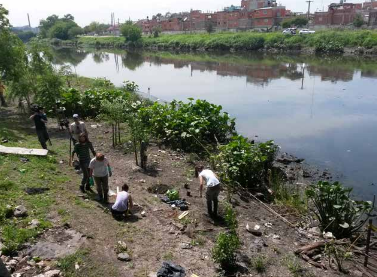
Figura 7. Proyecto piloto Puente Alsina, 6 meses después de la intervención (noviembre 2015).