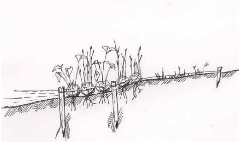
Figura 4. Esquema de plantación y fijación de bio-rollos.

En mayo 2015, se plantaron árboles y arbustos de mediano porte bajo el Puente Alsina: especies leñosas (árboles y arbustos) de bajo y mediano porte, de media sombra como saúco ( Sambucus australis , 4 m), fumo bravo ( Solanum granuloso-leprosum ), murta ( Myrceugenia glaucescens ), chal-chal ( Allophyllus edulis ), acompañadas por Lantana cámara y Cestrum parquii y herbáceas como Salvia procurrens , Tripogandra diurética y Tradescantia fluminensis . En el talud se plantaron pioneras como ceibo ( Erythrina crista-galli ), sauce criollo ( Salix humboldtiana ), fumo bravo ( Solanum granuloso-leprosum ) o de rápido crecimiento como la palmera pindó ( Syagrus romanzoffiana ) (Fig. 5).