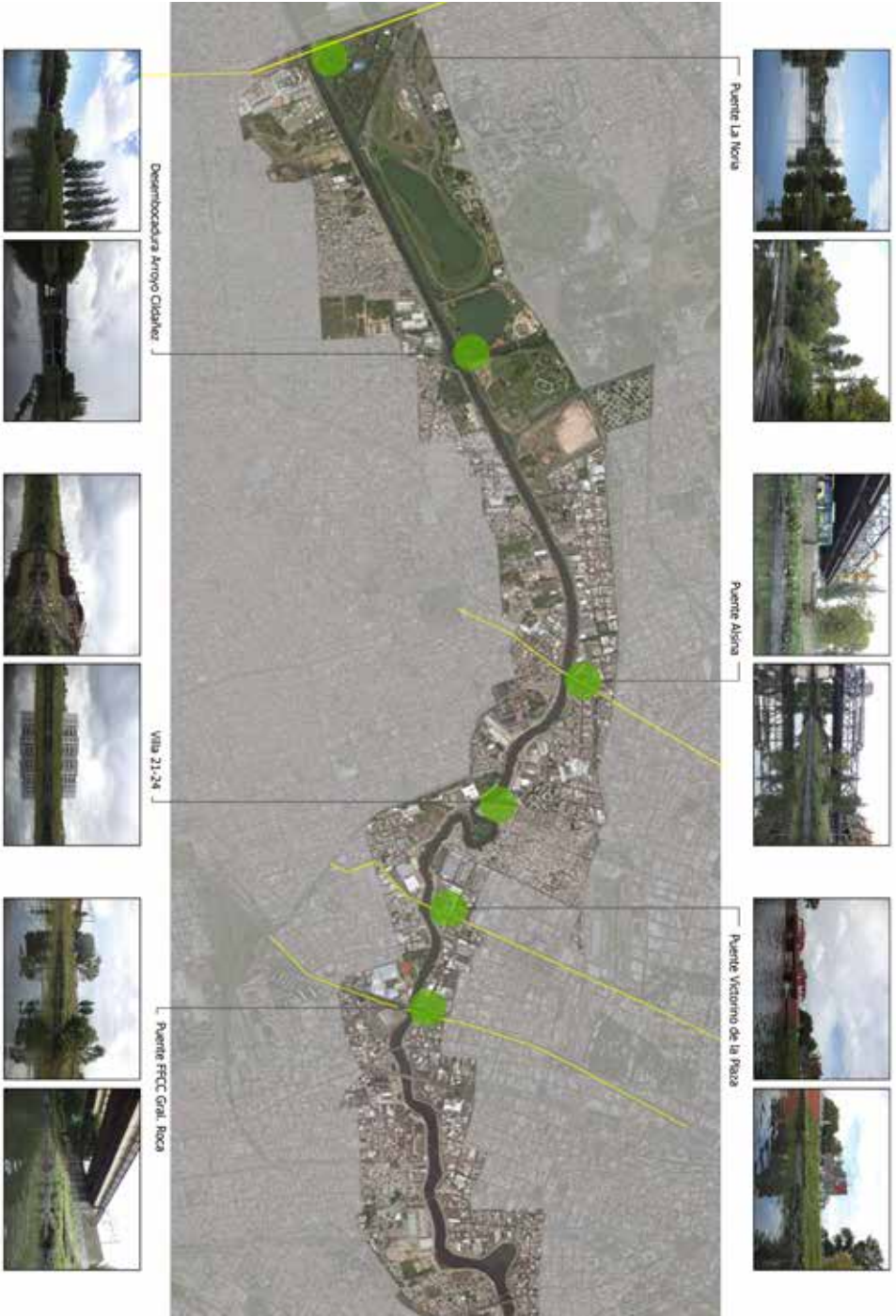
Figura 1. Selección de sitios plausibles de ser restaurados.