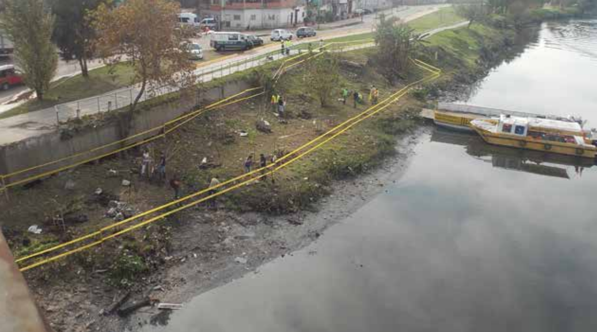
Figura 5. Día de intervención en la ribera de Puente Alsina (mayo 2015).

El día de la instalación de los bio-rollos se convocó a la Escuela Media EEM N°2 Arturo Jauretche de la zona para que los alumnos pudieran conocer la actividad y formar parte de ella (Fig. 6).