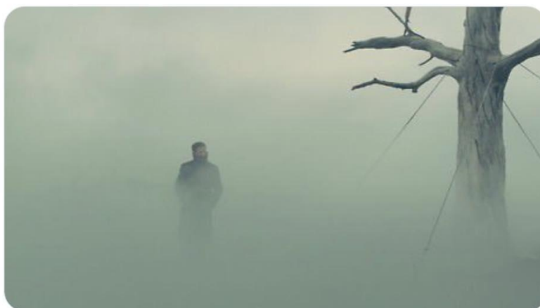
Ilustración 2. Imagen con metonimia de marca comercial

| cuando hacés patys a la plancha sin tener extractor de cocina.