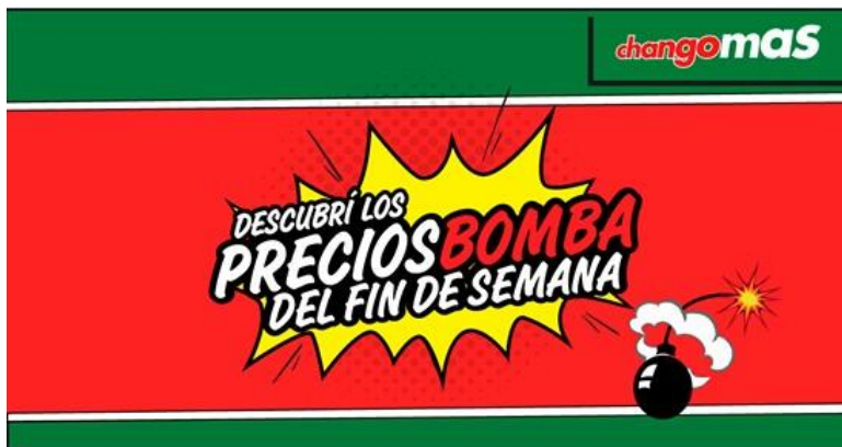
Ilustración 1. Imagen con expresiones metafóricas y metonímicas

Las imágenes seleccionadas eran diversos tipos de ilustraciones que circulaban en las redes sociales en el momento de la selección. El objetivo de la selección fue el de aprovechar el material que les resultaba familiar a los alumnos y que constituía parte de su contexto discursivo. Los géneros discursivos seleccionados son, principalmente, memes, pero también algunas noticias de diversas páginas web y algunas propagandas y publicidades. Para tener una idea del tipo de imágenes que se les enseñaron se puede consultar González (2018b: 67-74). Aquí solo colocaremos dos de las ilustraciones proyectadas por razones de extensión.