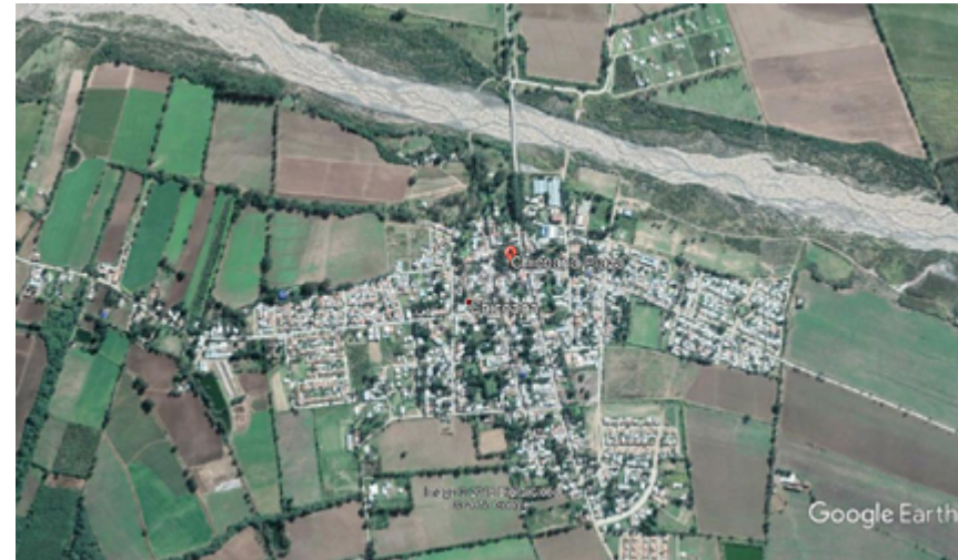
Imagen n°1. Situación urbana. Fuente: Extraído de Google Earth. Agosto de 2018.

En la Imagen n°2 se visualiza el partido adoptado por Luciano.