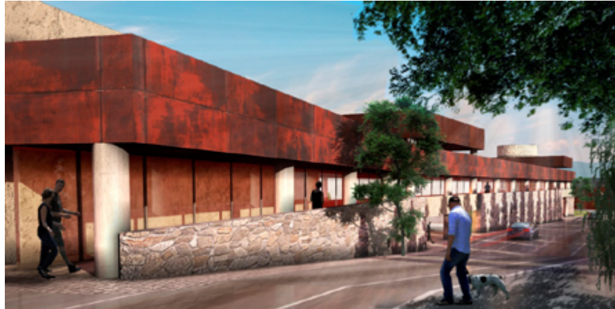
Imagen n° 5. Imagen digital del proyecto propuesto.

Mediante la investigación y la práctica en el taller, pudimos reflexionar sobre la importancia de incorporar la educación en valores. Estos se deben