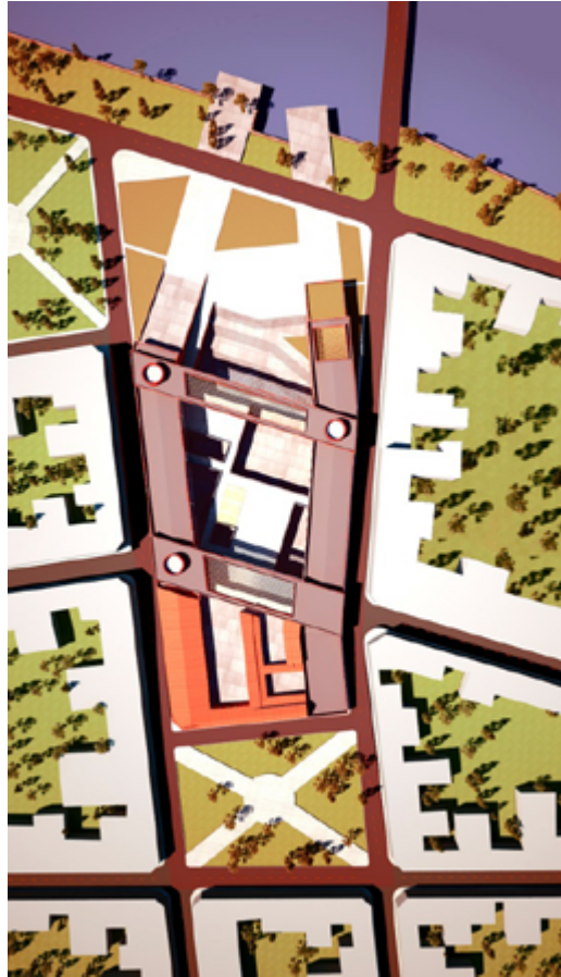
Imagen n°2. Planta de conjunto.