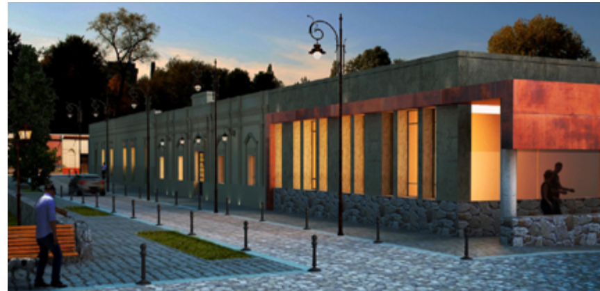
Imagen n°4. Fachada frente a la plaza.