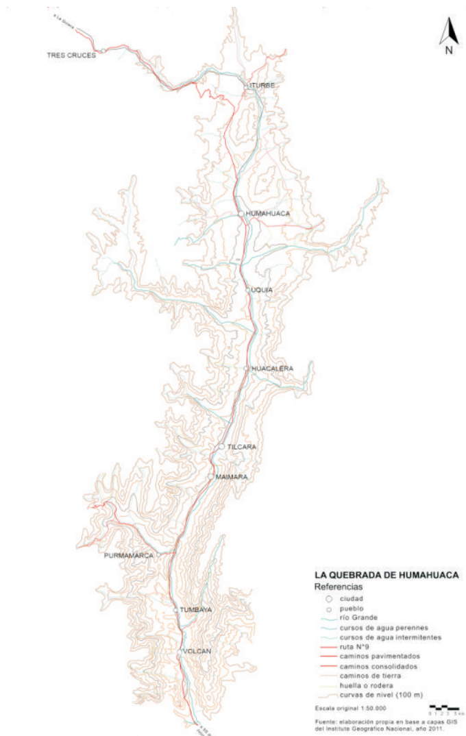
Figura 1: La Quebrada de Humahuaca

Durante los últimos años y fundamentalmente desde que fue declarada Patrimonio de la Humanidad, la bibliografía fue identificando algunos de los cambios desde la clave patrimonial (Paterlini, 2011) y desde las formas constructivas locales (Rotondaro, 2011); y otras notables transformaciones relacionadas también con los usos del suelo y el desarrollo