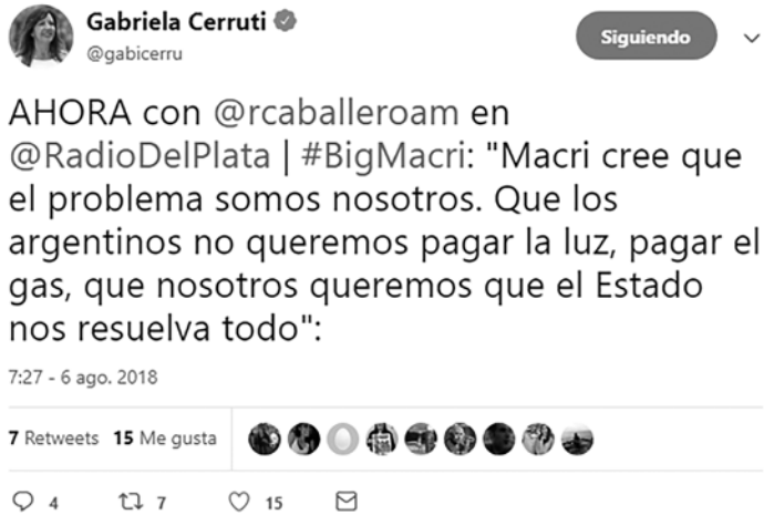
Gabriela Cerruti, 2018a.