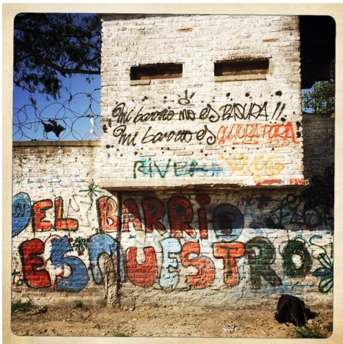
Fig. 1. Sin autor/a, Mi barrio no es basura, José León Suárez, 24 de noviembre de 2014, Blog Biblioteca Popular La Cárcova.