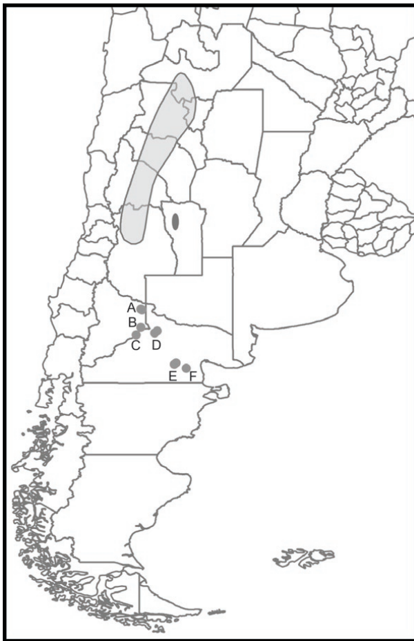
Figura 1. Distribución geográfica aproximada del Canastero Castaño ( Pseudasthenes steinbachi ) en Argentina. Área gris claro: distribución según Ridgely et al. (2007). Óvalo gris oscuro: distribución extra-andina en Sierra de las Quijadas. Puntos grises: nuevas localidades australes. Localidades (letras) y sitios (números) reportados en Tabla 1: NEUQUÉN. A) Auca Mahuida y alrededores [1-2], B) Senillosa [3]. RÍO NEGRO. C) Los Gigantes [4], D) Área Natural Protegida Paso Córdoba y alrededores [5-9], E) Chipauquil y Ea. El Rincón [10-11] y F) Sierra Pailemán [12].

El Canastero Castaño es marcadamente tricolor en el campo y a primera vista destacan en una rápida observación su cuerpo grisáceo parduzco, la región de la rabadilla y base de la cola coloradas y las porciones medial y distal de la cola negras. En observaciones más detalladas en plumaje fresco, son diagnósticos la presencia de un collar nual gris que se continúa a veces en la regiones auricular