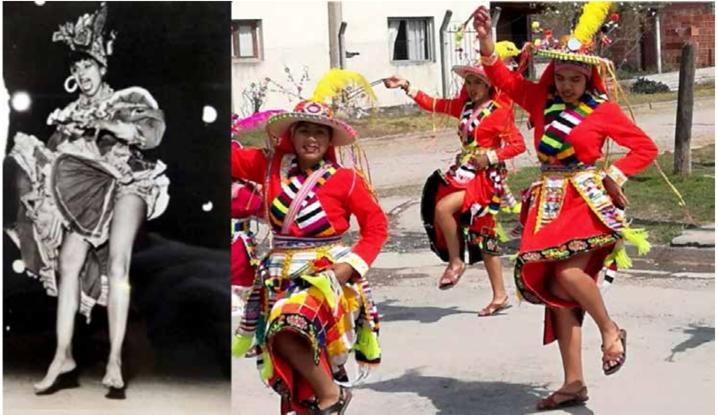
Montaje I. “Mujeres mostrando piernas”. Izquierda: K. Dunham; 1 derecha: bailarinas de tinku en La Silleta, pro- cesión en la Fiesta de Virgen de Copacabana, 2019.