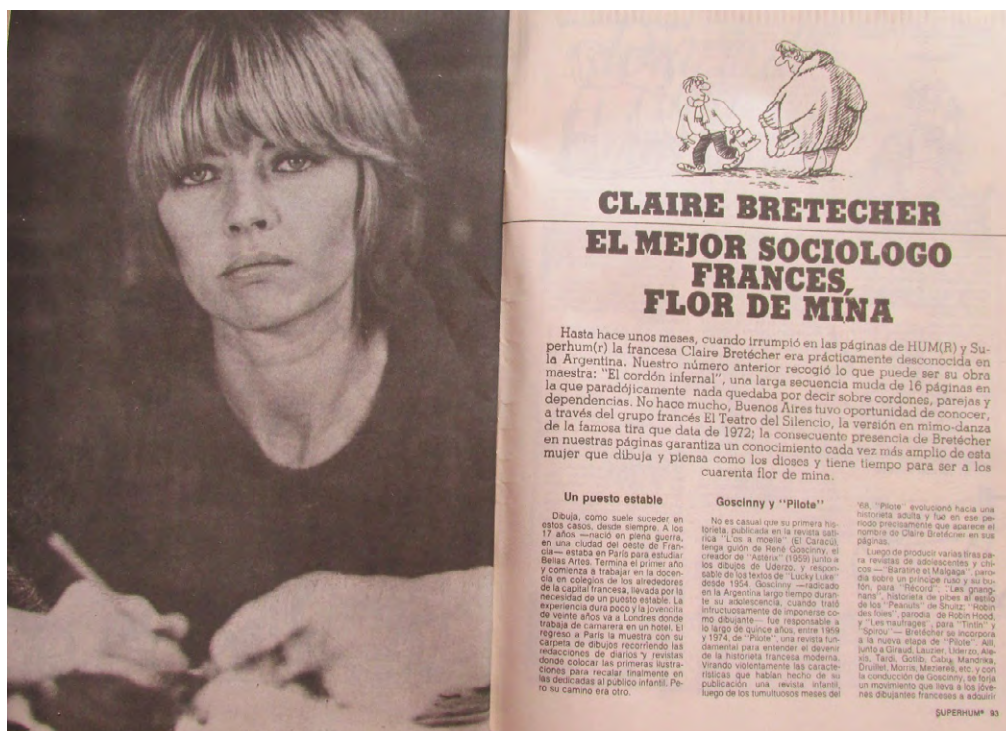
Fig. 5: SuperHUM ® n° 2, octubre de 1980