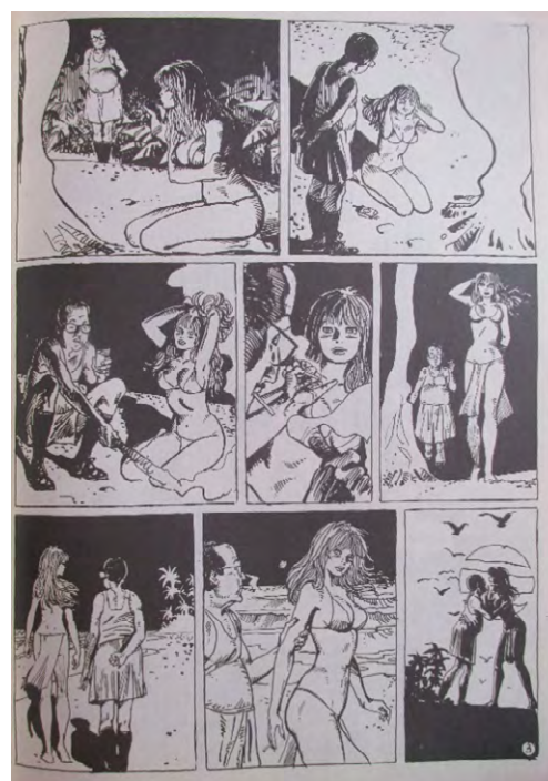
Fig. 10: Carlos Trillo y Horacio Altuna: “Las Puertitas del seños López”, HUM ®, 1980 (selección).

El cuerpo femenino fue representado de múltiples modos en HUM ®. Si bien se tomaba distancia de su antecesora Satiricón , que se había caracterizado por exaltar los cuerpos femeninos jóvenes y bellos a partir de la publicación de fotografías (Burkart, 2017; 2017b), en HUM ® estos quedaron restringidos a sus versiones gráficas y se combinaban con las caricaturas de famosas vedettes y actrices que hacía Andrés Cascioli para denunciar su connivencia con el poder militar o para denunciar la doble moral de la censura. (Figura 11) En esta polifonía visual, Claire Bretécher ofrecía una versión alternativa, diferente del cuerpo femenino.