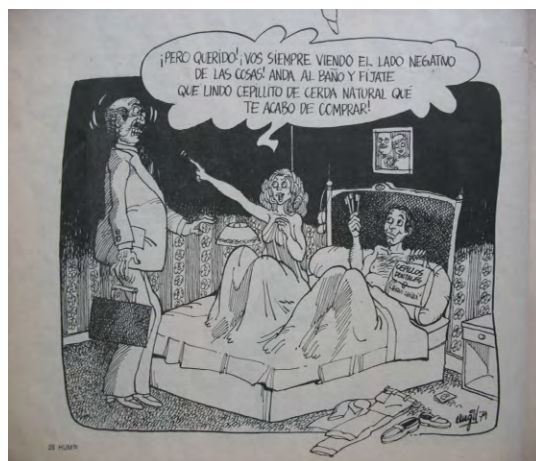
Fig. 14: Ángel, HUM ® n° 26, enero de 1980

En cuanto a la representación de los hombres, en las tiras hasta acá citadas vimos que pueden tener poca o nada de iniciativa, pueden temerle a las mujeres (y ese miedo es constitutivo de la subjetividad masculina en tanto viene desde el Origen, parece que sugiere la francesa) (“Paraíso”, HUM ® n° 30, marzo de 1980) y querer que estas se queden “En el lugar que la naturaleza le ha reservado” (“Feminismo”, HUM ® n° 28, febrero de 1980), también pueden cultivar una amistad “dura, viril...” donde es innecesaria la charla ya que la comunicación es por medio de golpes (“Virilidad”, HUM ® n° 36, junio de 1980). La presencia de los personajes masculinos se da, salvo en la tira “Virilidad”, en situaciones de pareja, es en la instancia relacional donde aparece la comicidad. Un tema ausente en las tiras de Bretécher es el adulterio, teniendo en cuenta la recurrencia de este tema en los chistes realizados por varones. Se trata de chistes en los cuales las adúlteras son siempre las mujeres y el efecto cómico está dado por el descubrimiento (o no) que hace el marido del amante de su esposa. Estos chistes que fueron recurrentes en Satiricón (Burkart, 2017) y, durante los primeros años, también en HUM ®, son producto de la “revolución sexual” que en los años sesenta le reconoció a las mujeres un nuevo lugar en la vida moderna y una vida sexuada para ellas como para los hombres. (Figura 14)