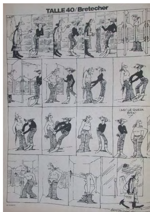
Figuras 6 (izq.) y 7 (der.): Claire Bretécher, HUM ® nº 52, enero 1981 y nº 85, julio de 1982