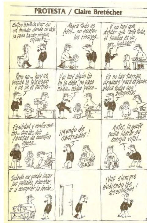
Fig. 12 (izq.) y Fig. 13 (der): Claire Bretécher, HUM ® n°75 enero de 1981 y HUM ® n° 31, abril de 1980

En los abordajes de Bretécher sobresalen la libertad y la ausencia de pretextos y rodeos, constituyéndose en una novedad para el humor costumbrista argentino. Las mujeres de Bretécher pueden, en una cita, tomar la iniciativa para tener sexo (Bretécher, “Casanova”, HUM ® n°75 enero de 1981. Figura 12) o comer chucrut y dejar a un lado la seducción (Bretécher, “Chucrut”, HUM ® n° 76, febrero de 1982), lidian con sus cuerpos y las culpas que generan los patrones de belleza imperantes, como también las vendedoras despiadadas (Bretécher, “Estilo”, HUM ® n° 27, enero de 1980; “Gimnasia”, HUM ® n° 52, enero 1981 y “Talle 40”, n° 85, julio de 1982, “Se viene el calor”, HUM ® n° 89, agosto de 1982. Figura 6 y 7). En estas mujeres pesa la obligación de existir pendientes de cómo se ven a sí mismas y de cómo las ven los demás. En cambio, los hombres no viven esa presión y tampoco se los muestra como responsables de la situación de las mujeres, más bien aparecen pasivos o temerosos ante ellas. La mayor novedad para el humor gráfico, no obstante, es el hecho de que no es un autor-varón burlándose de mujeres sino una autora-mujer riéndose de y con sus congéneres. A esta capacidad de reírse de uno mismo, de estar comprometido en la propia humorada, Freud ([1927] 1988; [1905] 1986) la llamó humor y lo diferenció de lo cómico, que implica reírse de otro (Steimberg, 2013). El humor implica el involucramiento del autor en la humorada.