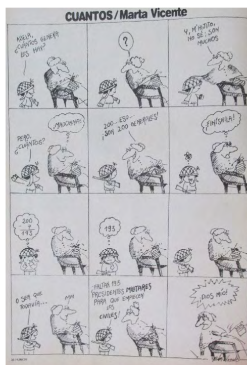
Fig. 15 (izq.) y Fig. 16 (der.): Marta Vicente, “Liberación”, HUM ® n° 63, julio de 1981 y “Cuantos”, HUM ® n° 86, julio de 1982