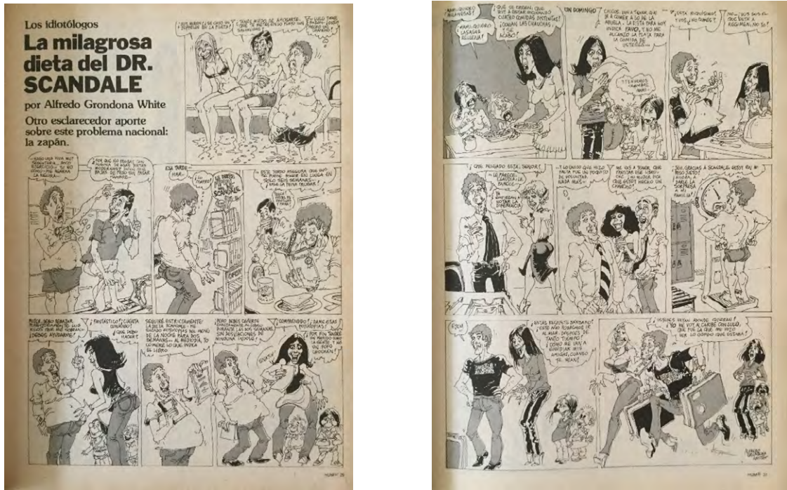
Fig. 8: Alfredo Grondona White, HUM® nº 26, enero de 1980 (selección)