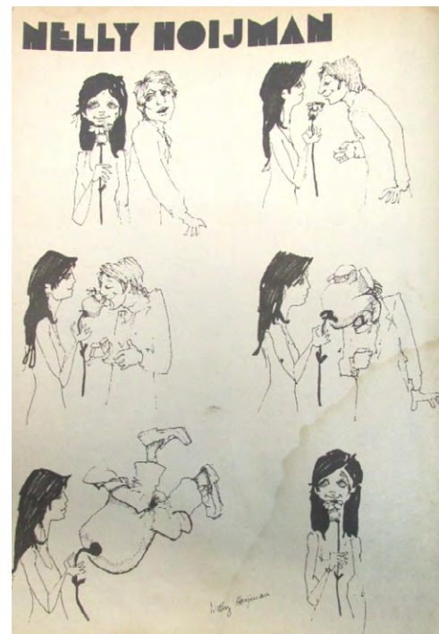
Figuras 1 (izq.) y 2 (der.): Nelly Hoijman, Mengano nº 6, octubre de 1974

Hojman es arquitecta y comenzó a dibujar sus tiras a modo de hobby. Un conocido le sugirió publicarlas y fue así que lo hizo en la revista Siete Días , de la editorial Abril, y luego, en Mengano . (Figura 2) Sin embargo, su participación en esta última fue breve: dejó la revista cuando una de sus tiras salió publicada con cambios que no le habían sido informados y con los cuales quedó disconforme. 7 De este modo quedó abortado el “punto de vista femenino” dentro de una de las revistas que aspiraba a ser una de las principales publicaciones de humor gráfico del país. Hoijman al poco tiempo dejó de publicar para dedicarse a su otra profesión. Mengano cerró unos meses después del golpe de Estado de marzo de 1976.