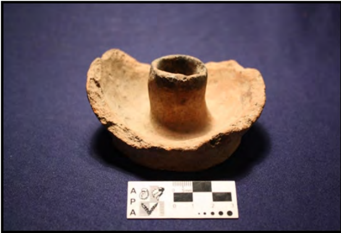
Figura 9: Ejemplo de nueva funcionalidad (Candelabro –pieza sin referencia de colección o procedencia-)