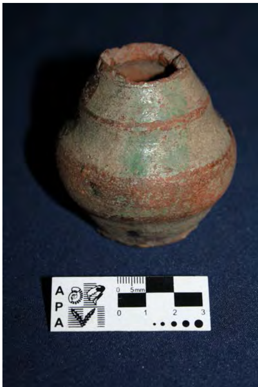
Figura 4: Ejemplo de manufactura con torno y vidriado de superficie (mate -MLP-Ar-(v)6076 – Colección Bruch).