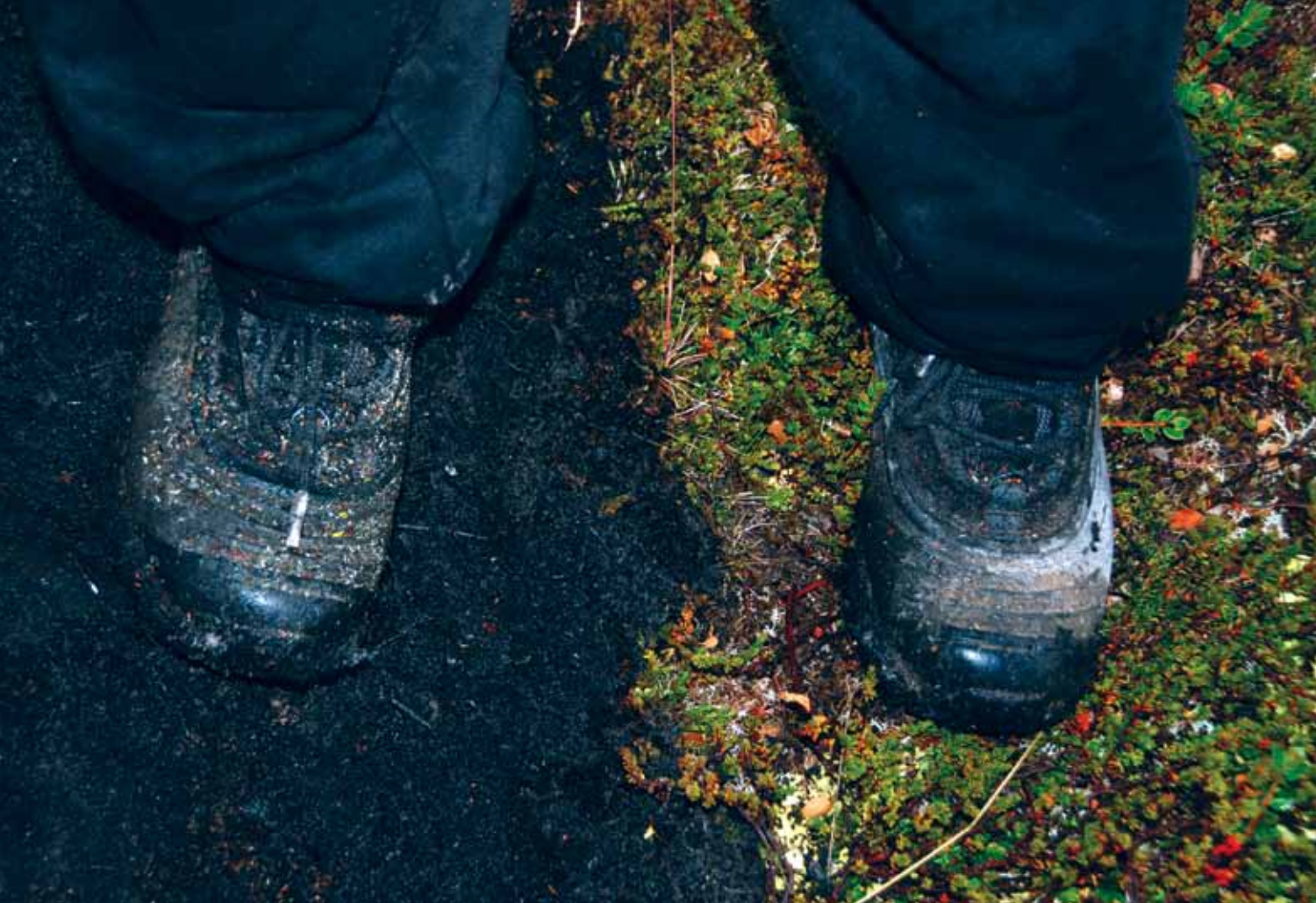
Figura 1: El antes y el después del incendio forestal en Bahía Torito.

na. La cantidad de dichos gases puede sobrepasar, incluso, las emisiones durante la combustión misma.