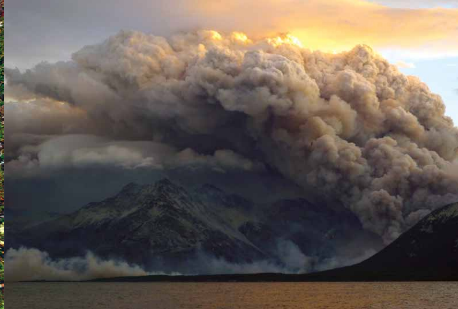
Figura 2: Emisiones de gases liberados a la atmósfera producto del incendio forestal de Bahía Torito.

Al mismo tiempo, ocurren cambios en las propiedades físicas del suelo, como la humedad y la capacidad de retención