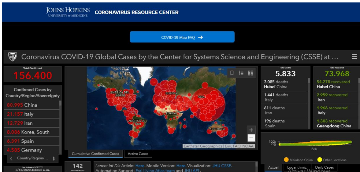
Figura 3 Mapa interactivo de Johns Hopkins University mediante GIS-On-line