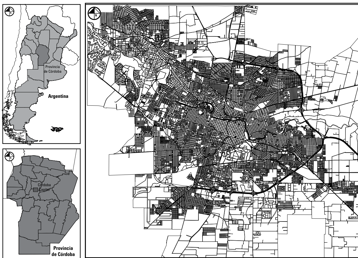
Figura 1. Mapa de ubicación de la ciudad de Córdoba, Argentina. Datos: Dirección General de Estadísticas y Censos 2008a.

también una fuerte avanzada del sector tecnológico con la instalación de empresas relacionadas con el software y la alta tecnología (Valdes y Coch 2009).