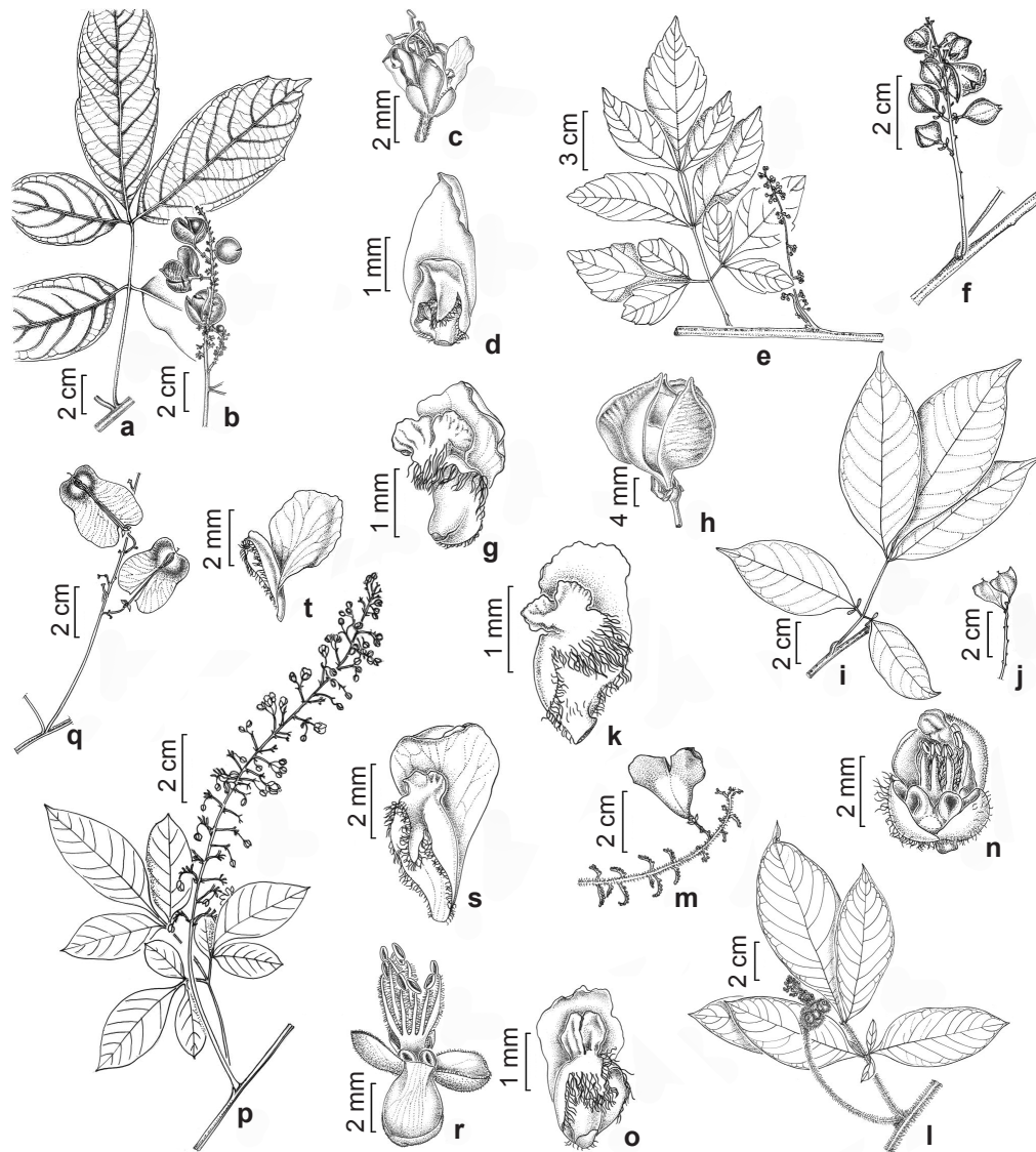
Figura 3 – a-d. Paullinia ferruginea – a. ramo vegetativo; b. ramo com cápsulas maduras; c. flor estaminada; d. face adaxial da pétala posterior, evidenciando apêndice petalífero. e-h. Paullinia micrantha – e. ramo com flores; f. ramo com frutos; g. face adaxial da pétala posterior, evidenciando apêndice petalífero; h. cápsula madura expondo parcialmente uma semente arilada. i-k. Paullinia racemosa – i. ramo vegetativo; j. ramo com frutos imaturos; k. face adaxial da pétala posterior, evidenciando apêndice petalífero. l-o. Paullinia revoluta – l. ramo com flores; m. ramo com cápsula madura; n. flor pistilada desprovida da sépala posterior e da corola, evidenciando os lobos nectaríferos; o. face adaxial da pétala posterior, evidenciando apêndice petalífero. p-t. Serjania salzmanniana – p. ramo com flores; q. ramo com frutos; r. flor estaminada desprovida da corola, evidenciando lobos nectaríferos; s. face adaxial da pétala posterior, evidenciando apêndice petalífero; t. face adaxial da pétala anterior evidenciando apêndice petalífero. (a-d Paixão 51; e, g Sylvestre 997; f, h Fernandes 779; i-j Perdiz 421; k Santos 288; l, n-o Perdiz 564; m Perdiz 487; p, r-t Carvalho 7006; q Cardoso 1636). Figure 3 – a-d. Paullinia ferruginea – a. sterile branch; b. branch with mature capsules; c. staminate flowers; d. adaxial view of posterior petal showing adnate appendage. e-h. Paullinia micrantha – e. branch with flowers; f. branch with fruits; g. adaxial view of posterior petal, showing adnate appendage; h. mature capsule, partially exposing an arillate seed. i-k. Paullinia racemosa – i. sterile branch; j. branch with fruits showing immature capsules; k. adaxial view of posterior petal showing adnate appendage. l-o. Paullinia revoluta – l. branch with flowers; m. branch with mature capsule; n. pistillate flower devoid of posterior sepal and corolla, showing nectary lobes; o. adaxial view of posterior petal, showing adnate appendage. p-t. Serjania salzmanniana – p. branch with flowers; q. branch with fruits; r. staminate flower devoid of corolla, showing nectary lobes; s. adaxial view of posterior petal showing adnate appendage; t. adaxial view of anterior petal, showing adnate appendage. (a-d Paixão 51; e, g Sylvestre 997; f, h Fernandes 779; i-j Perdiz 421; k Santos 288; l, n-o Perdiz 564; m Perdiz 487; p, r-t Carvalho 7006; q Cardoso 1636).